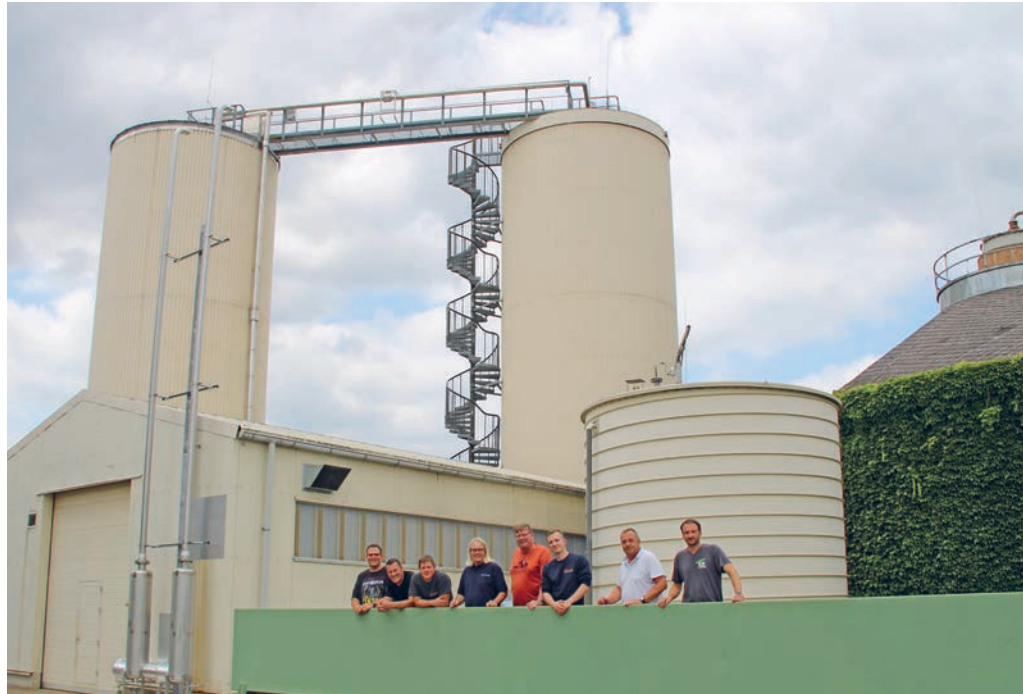
Das Bild vom Team der Kläranlage ist vor der Corona-Pandemie entstanden.

Das gereinigte Abwasser wird nach umfangreichen Analysen im hauseigenen Labor über die Tauber in den na-