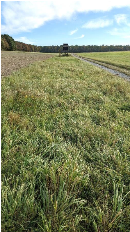
Abb.5: Breiter Wegesaum parallel zum Wirtschaftsweg an der Reißklinge