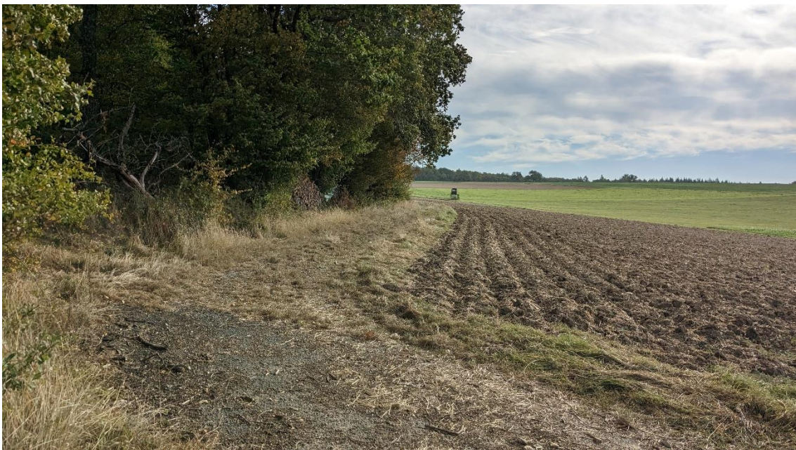
Abb.3: Grasweg nördlich des Plangebietes parallel zum Waldrand