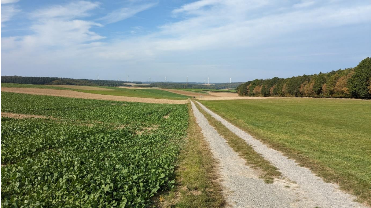
Abb.2: Blick auf den zentralen Schotterweg parallel zur Reißklinge in Richtung Westen