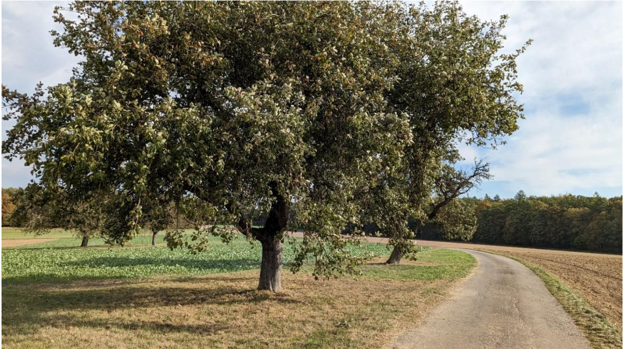
Abb.4: Blick von der Südostecke des Plangebietes – Alter Obstbaumbestand