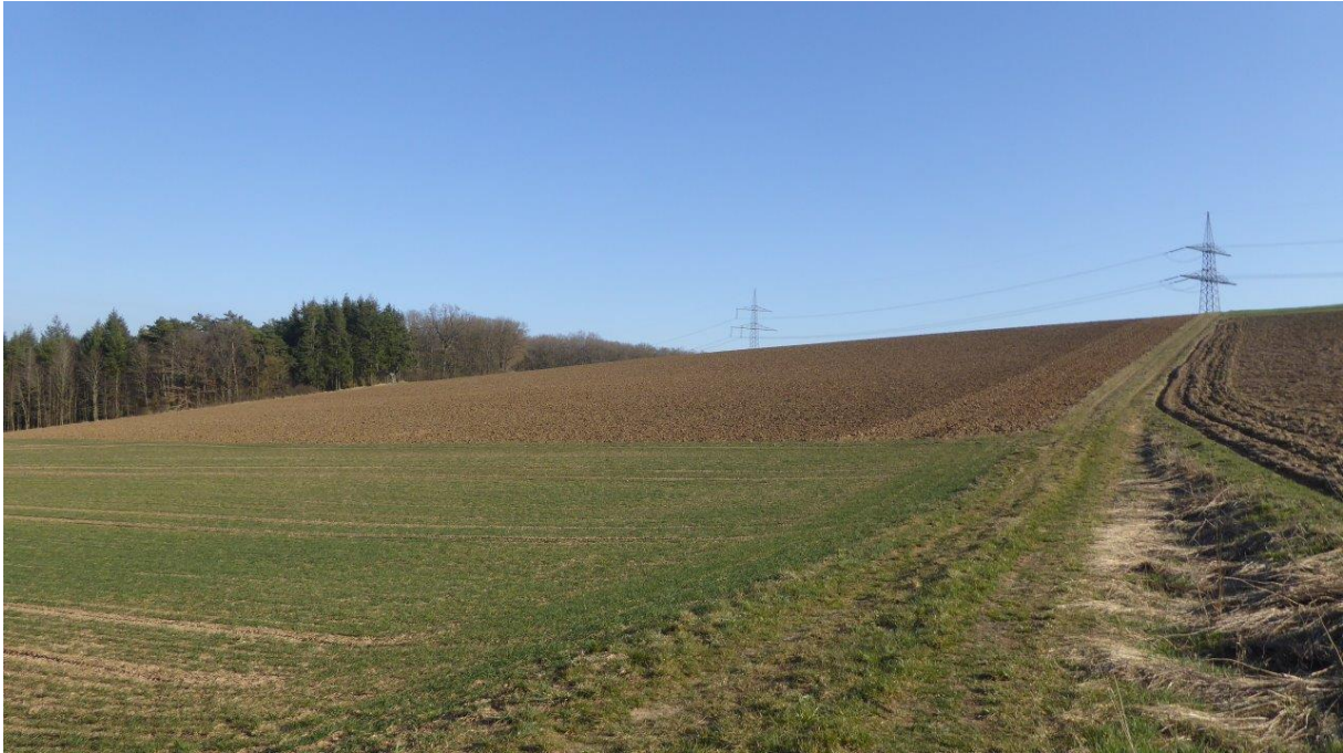
Abb.2: Blick von Norden nach Südosten auf das Baugrundstück