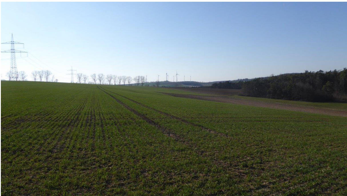
Abb.3: Blick von Osten auf das Baugrundstück (Blickrichtung nach Westen)