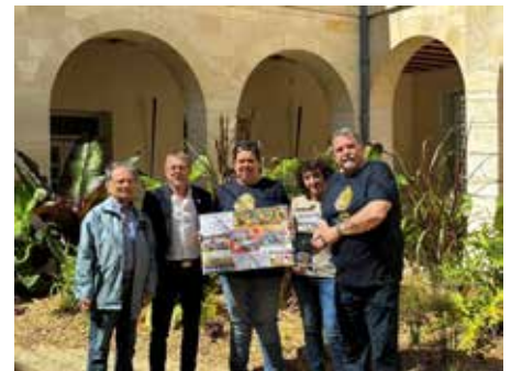
Das Team der HSG Dittigheim/ Tauberbischofsheim Ib im Innenhof des Rathauses in den von den französischen Freunden erhaltenen Jubiläums-T-shirts.

Der Nachmittag stand dann ganz im Zeichen des Sports. Umrahmt von mehreren Auftritten der Majoretten von „Majovals“ aus Vitry trafen zunächst die weibliche Jugend des ASV und ein