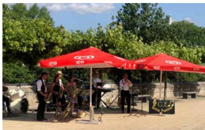
Dixie Eight bereichert am Samstag, 13. Juli, den Kultursommer Tauberbischofsheim.

Nach dem großen Erfolg des Förderprogramms „WirGarten“ im vergangenen Jahr freuen wir uns auch in diesem Sommer auf die Darbietungen aller Teilnehmenden, die den Kultursommer abwechslungsreich mitgestalten.